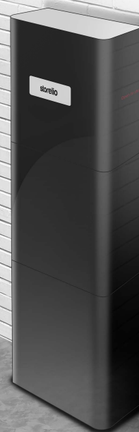
La production solaire en excès le jour est utilisée le soir