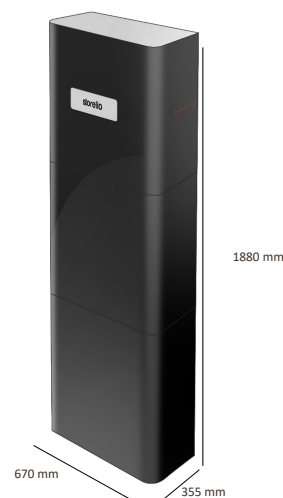
Installation au sol